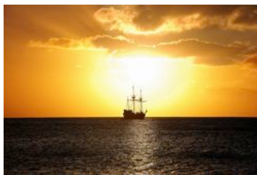
Namo Amida Butsu

Etwa genau so werden sich wohl jene fühlen, die nach langem sorgvollen Bemühen um eine gesicherte Wiedergeburt, das gigantische Schiff des Nembutsu besteigen und sich der ruhigen und entspannten Überfahrt anvertrauen.